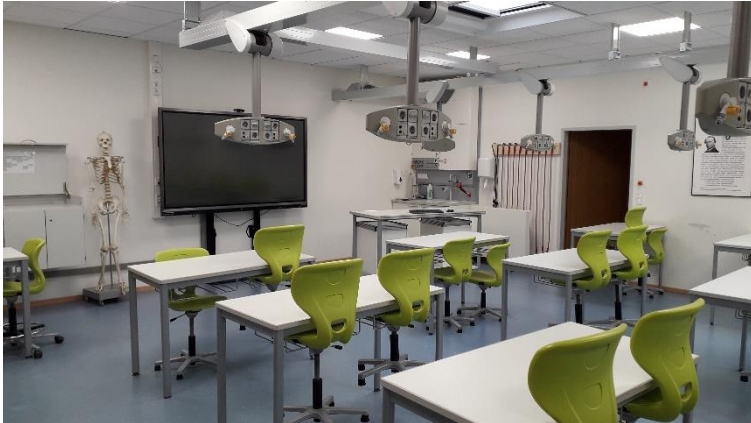
Abbildung 1: Blick in den Fachraum B014

das Fachgebiet der Biologie ist sehr umfangreich und lässt sich in folgende ja Bereiche unterteilen: allgemeine Zoologie und Botanik, Physiologie, Biochemie, Biophysik, Ökologie, Anthropologie und theoretische Biologie.