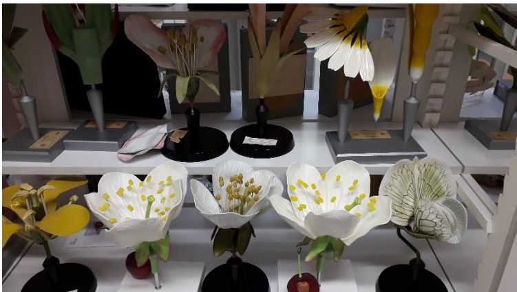
Abbildung 3: Verschiedene Blütenmodelle

Wir verfügen in unserer Sammlung über zahlreiche Modelle und Anschauungsobjekte, die das Lernen anschaulich und begreifbar machen.